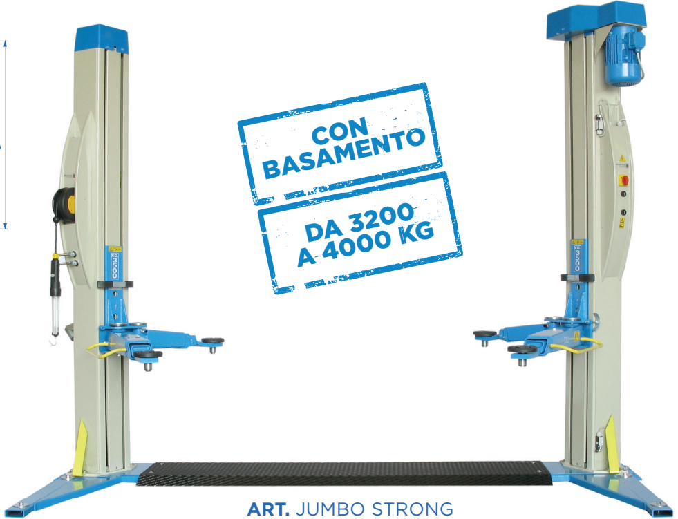
ART. JUMBO STRONG