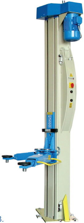
ART. JUMBO STRONG F.B.